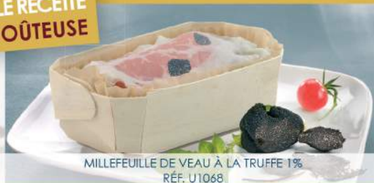
MILLEFEUILLE DE VEAU À LA TRUFFE 1% RÉF. U1068

Cellier du Périgord - Hôtel de Maleville - Placé de la Liberté - BP 39 - 24201 Sarlat cedex contact@cellierdupericord.com - Tél. 05 53 30 81 30 - Fax : 05 53 30 81 39