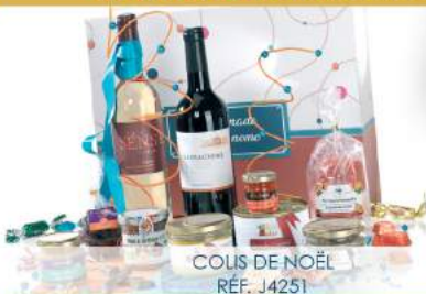
COUS DE NOËL RÉF. J4251